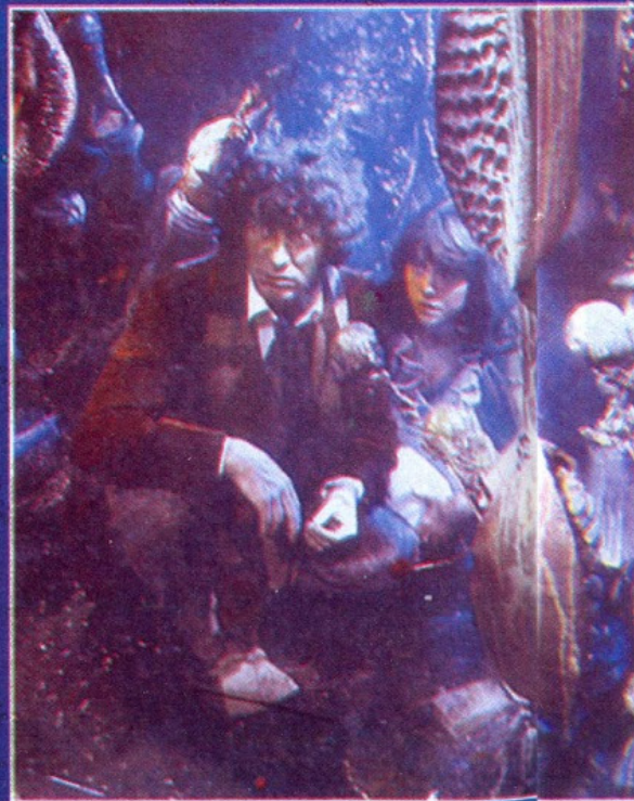
El doctor Who, interpretado por Tom Baker, junto a Elisabeth Sladen, una de sus más populares acompañantes.

activo club de "fans" que hace la competencia a los célebres "trekkers", los fanáticos seguidores de "Star Trek", que fue la primera serie mítica de la ciencia-ficción televisiva. Una exposición ambulante de carácter permanente recorre Estados Unidos desde el pasado año, e incluye muestras del vestuario, decorado, prototipos y modelos de los "monstruos", etcétera, así como todo el material bibliográfico y de video hasta ahora editado sobre la serie.