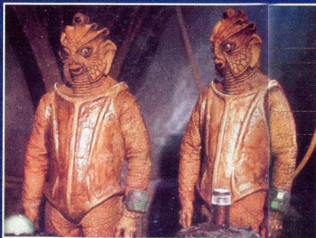
Los silurians son reptiles de gran inteligencia y asombrosos poderes.

tor Who, que hacen frecuentes apariciones en la serie cuando su héroe viaja a través del tiempo y del espacio.