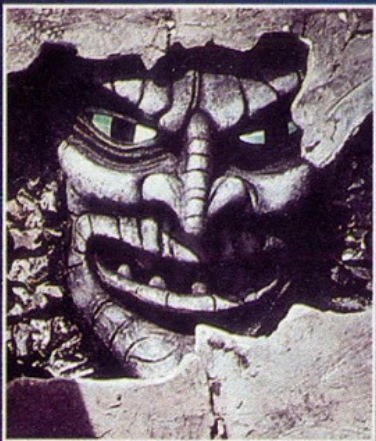
Uno de los monstruos enemigos del doctor, "El Malo".