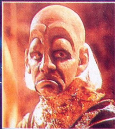
En la serie destaca la excelente labor de caracterización de sus personajes.