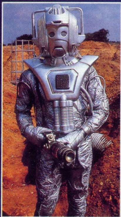
Cyberman, uno de los más poderosos contrincantes del doctor Who.