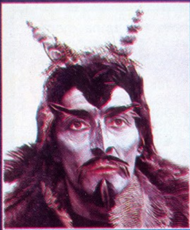
Otro de los monstruos, el exótico Drek.

El éxito de "Doctor Who" tuvo tal resonancia que sus personajes fueron exhibidos por todos los Estados Unidos.