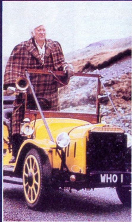
Con Jon Pertwee, el personaje del doctor Who adquirió un carácter más distinguido.