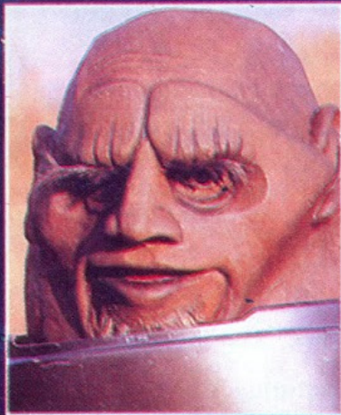
Sentaran, una de las criaturas del espacio.